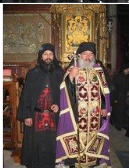
Акакије Методије и јеромонах