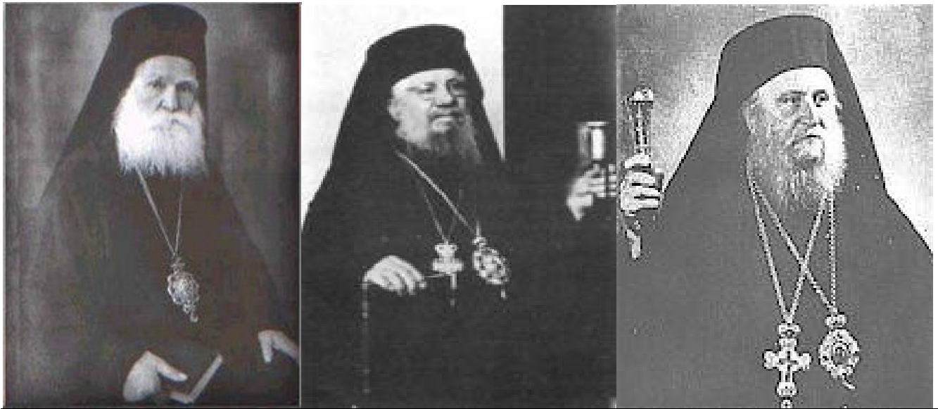
првојерарси грчке ипц